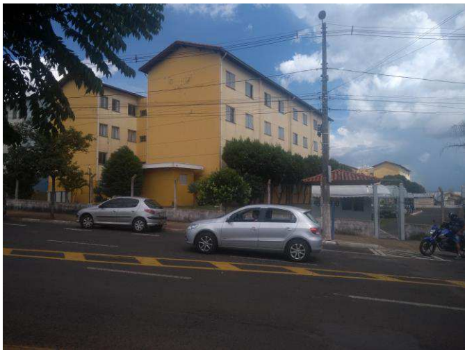
FOTO 01 – Visualiza a entrada principal do Conjunto Habitacional Parque Wilson Presotto, com frente para a Avenida Concordia, nºs 4.570 e 4900.