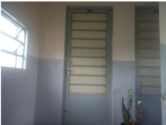
FOTO 03 – Visualiza a porta de entrada do apartamento nº41, 3º andar do Bloco “D”.

Este documento é cópia do original, assinado digitalmente por IVO MARCACINI JUNIOR e Tribunal de Justiça do Estado de São Paulo, protocolado em 31/01/2020 às 15:18, sob o número WFAC20700154752. Para conferir o original, acesse o site https://esaj.tjsp.jus.br/pastadigital/pg/abrirConferenciaDocumento.do , informe o processo 0017624-32.2018.8.26.0196 e código 5A3D827.