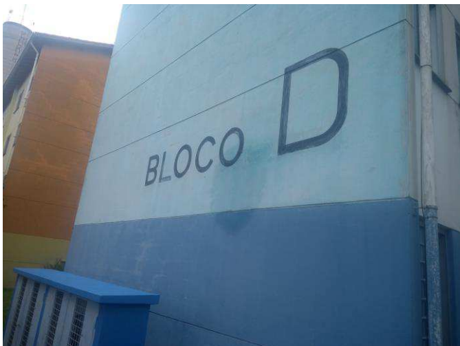
FOTO 02 – Visualiza o Bloco “D” do Conjunto Habitacional Parque Wilson Presotto.